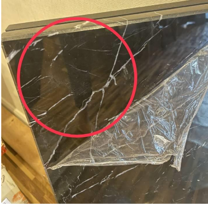
รูปถ่ายจากคุณพี ร่องรอยแตกของโต๊ะเดิมที่ถูกเปลี่ยนออกไป

21 ธ.ค. 64 คุณพีแจ้งกลับว่ามีการเปลี่ยนโต๊ะจริง เนื่องจากตัวเดิมที่ได้ตรวจรับไปแล้วมีรอยแตก(ดังรูปแนบ) และจะทำการซ่อมแซมตัวที่อยู่ในห้องให้ ซึ่งผมไม่ยินดียรับทั้ง 2 ตัว ทั้งตัวเดิมวันที่ตรวจรับ (ที่มีรอยแตกโดยไม่ทราบสาเหตุ) และตัวในห้องที่ถูกเปลี่ยนเข้ามาใหม่ ผมตรวจรับห้องไปแล้ว แต่ไม่อาจทราบได้ว่าเกิดรอยแตกขึ้นได้อย่างไร