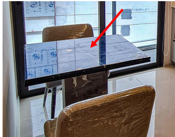
zoom + crop + color edited สังเกตว่ามีลายสีขาวเพียงเส้นเดียว