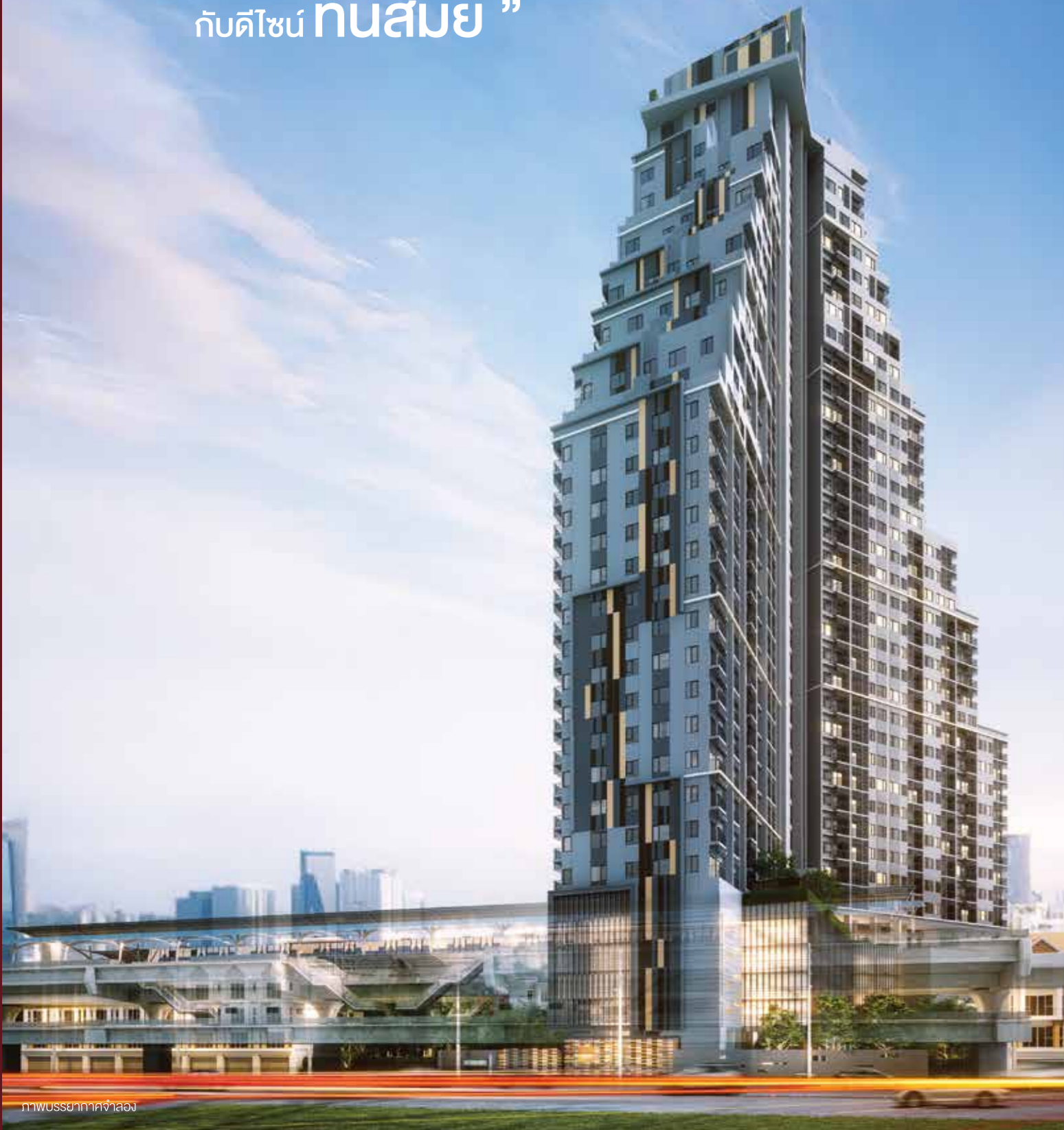
ภาพบรรยากาศจำลอง