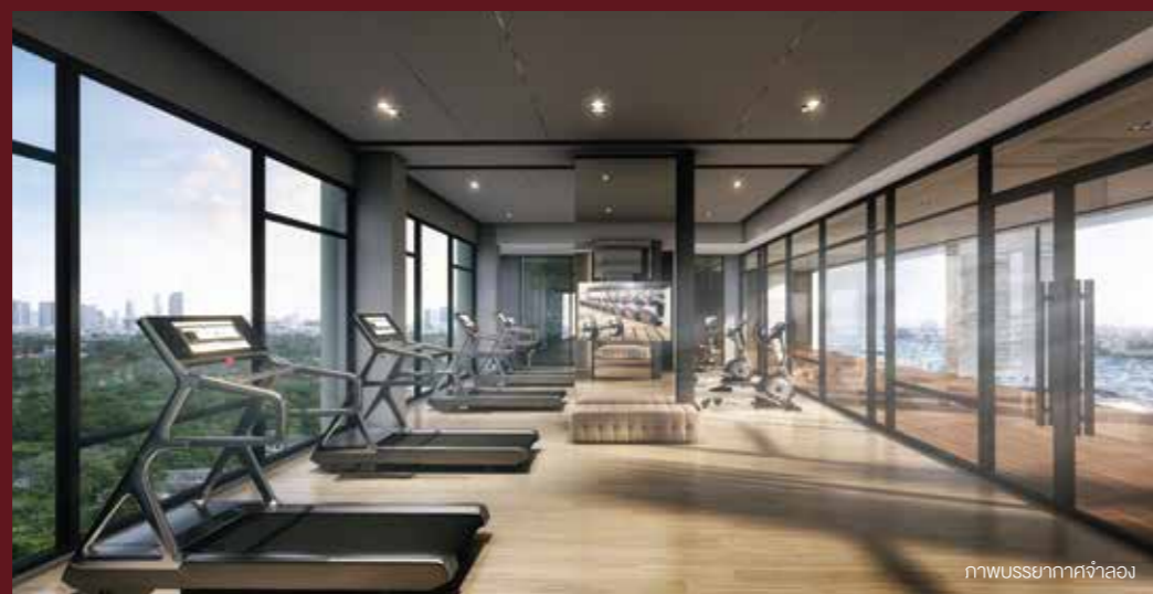
ภาพบรรยากาศจำลอง