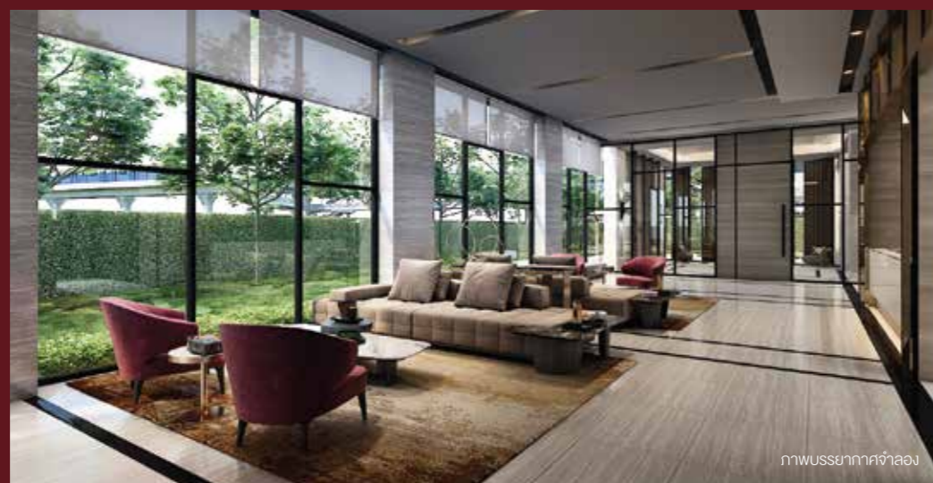
ภาพบรรยากาศจำลอง

เลือกความเป็นตัวตนด้วยรูปแบบการดีไซน์อาคารที่แตกต่าง บนทำเลที่โดดเด่น ติดสถานีรถไฟฟ้า สะดวกสบายในสังคมเมือง ผสมคุณค่าของชุมชนดั้งเดิม