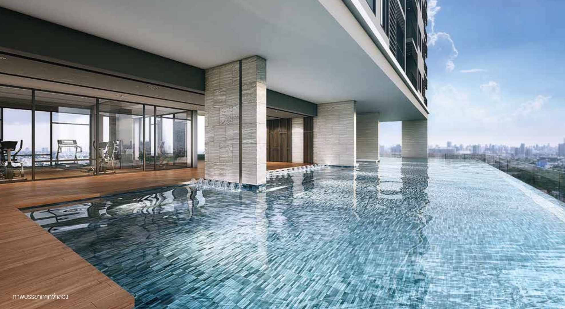
ภาพบรรยากาศจำลอง