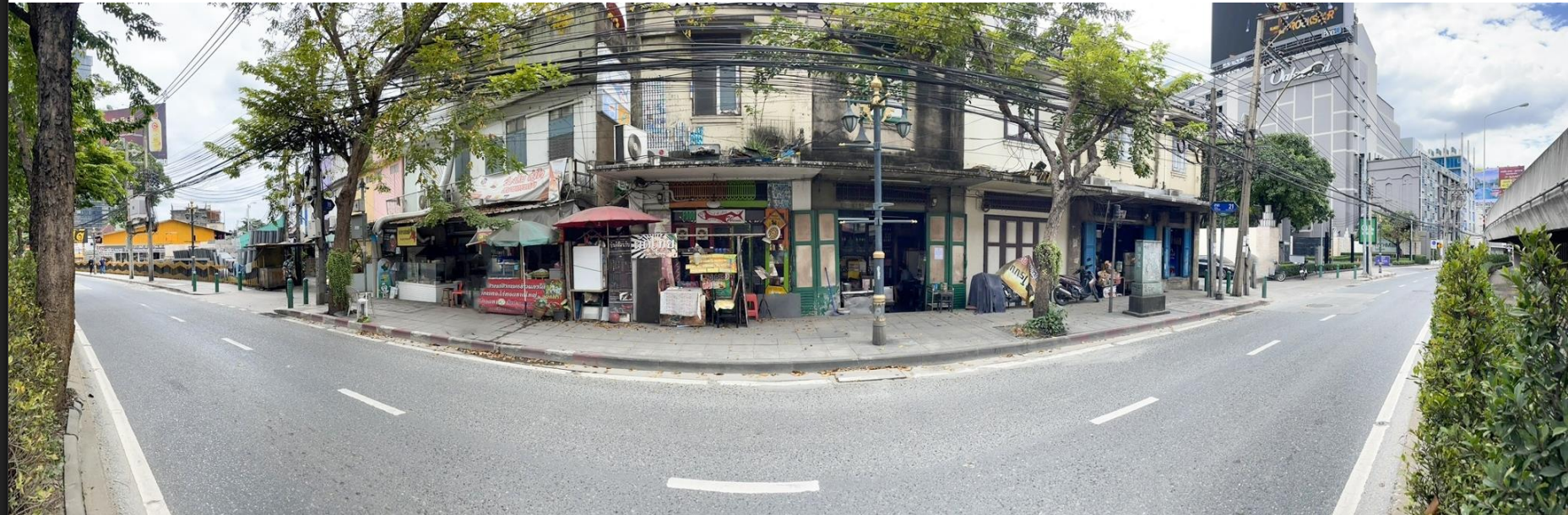
ที่ดินหน้าถนนซอยสาทร 19 และ ซอยสาทร 21