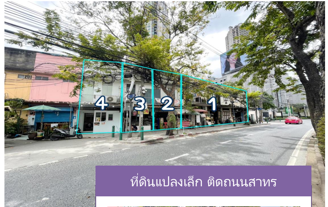
ที่ดินแปลงเล็ก ติดถนนสาทร