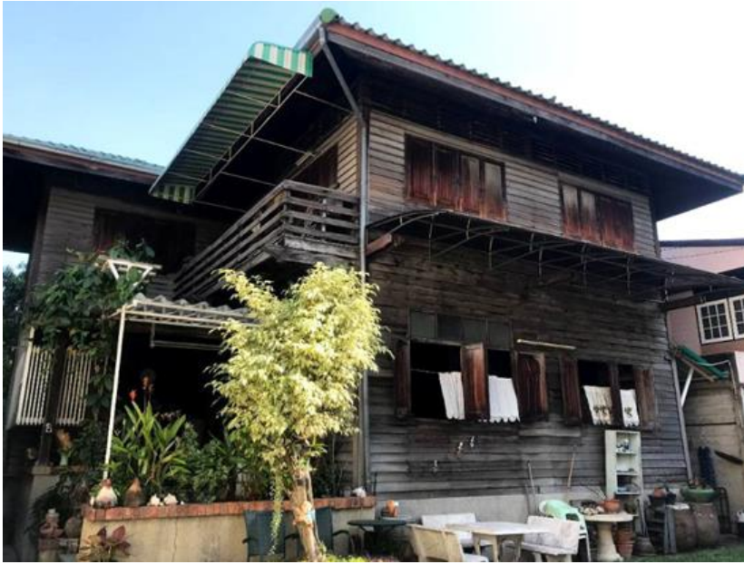
ที่ดินแปลงใหญ่ พร้อมบ้านไม้ทรงไทย ห่างจาก ปากซอยสาทร 21 เพียง 9 เมตร