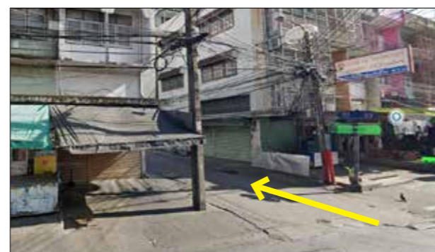
ทางเข้าซอยสาหร่ายทองคำ/พื้งมี 32