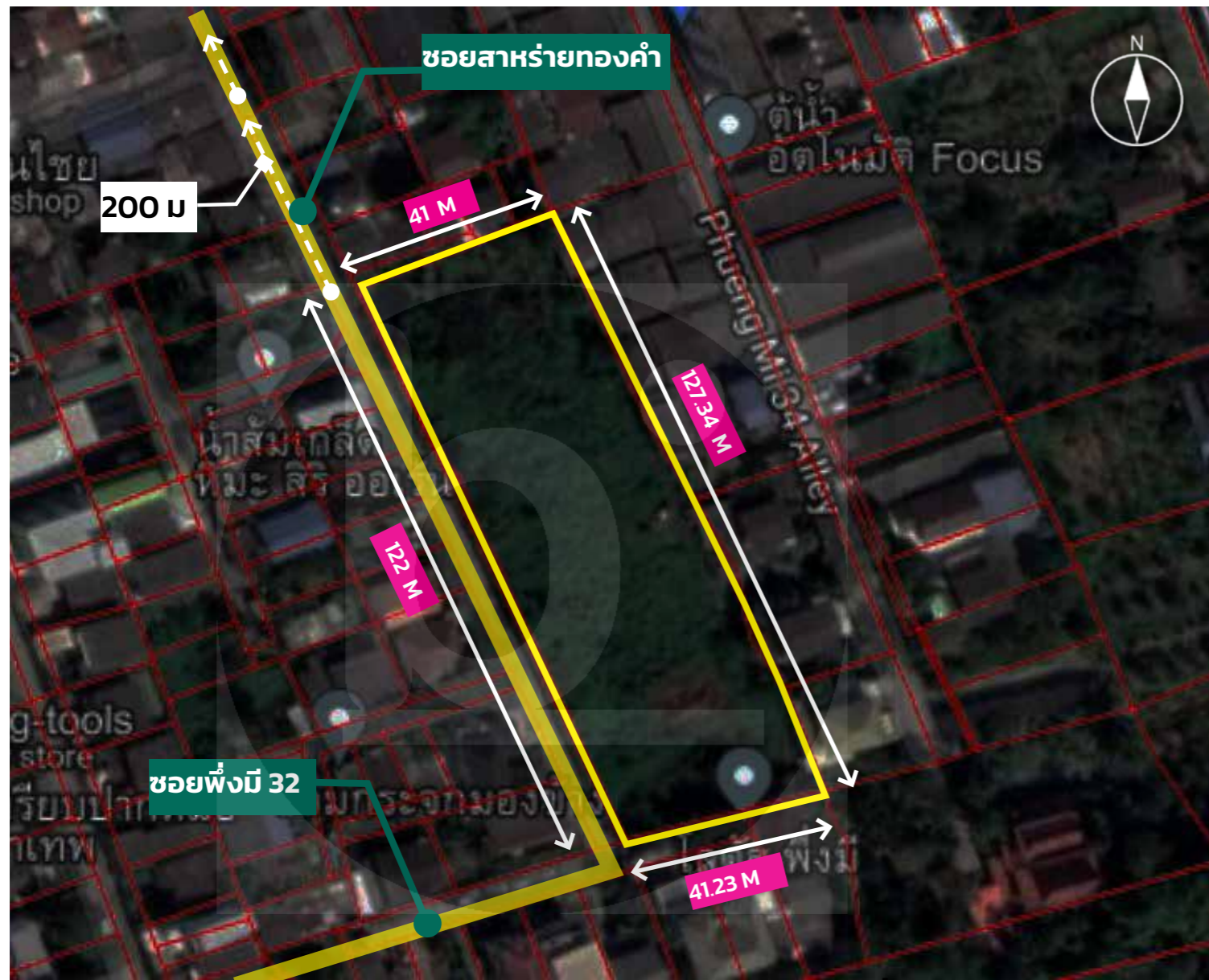
ผังของที่ดินตามเอกสารสิทธิ์