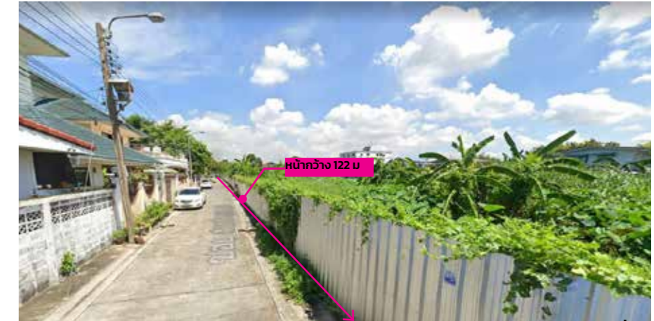
ด้านหน้าที่ดิน

3-0-29.5 ไร่ ที่ดิน ซอยสุขุมวิท 93 ห่าง MRT+BTS บางจาก 1.7 กิโลเมตร