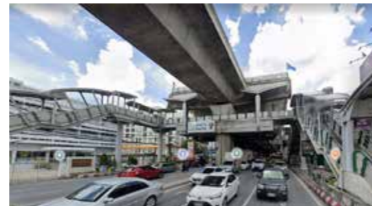
สถานี BTS+MRT บางจาก