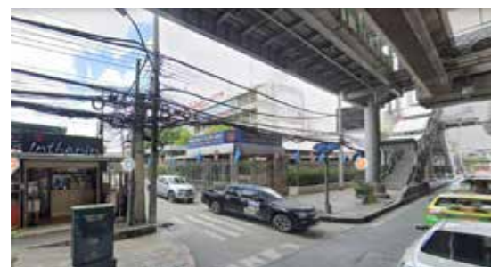
ทางเข้าจากซอยสุขุมวิทซอย 50