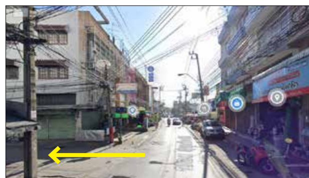
ถนนด้านหน้าทางเข้า