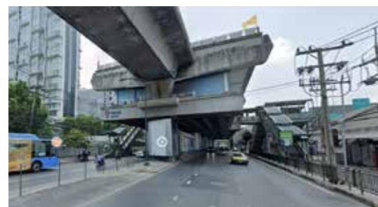
สถานี BTS+MRT อ่อนนุช