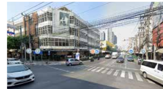
ถนน อ่อนนุช