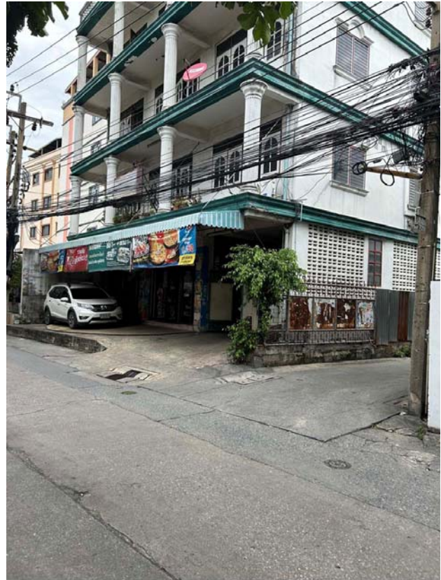
บริเวณถนนหน้าทางเข้าที่ดิน กว้าง 6 เมตร ห่างจากปากซอยอินทามระ 41 240 เมตร และห่างจาก MRT สุทธิสาร 1 กิโลเมตร