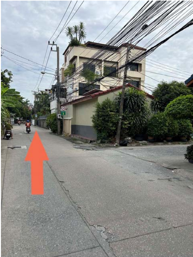
บริเวณซอยอินทามระ 41 ซึ่งเป็นตัว U สามารถเชื่อมไปออกซอยจิบตำริห์ ระยะทาง 550 เมตร เพื่อออกไปฝั่งถนนรัชดาได้ไวขึ้นในชั่วโมงเร่งด่วน