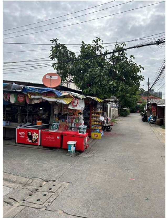
บริเวณภายในที่ดิน