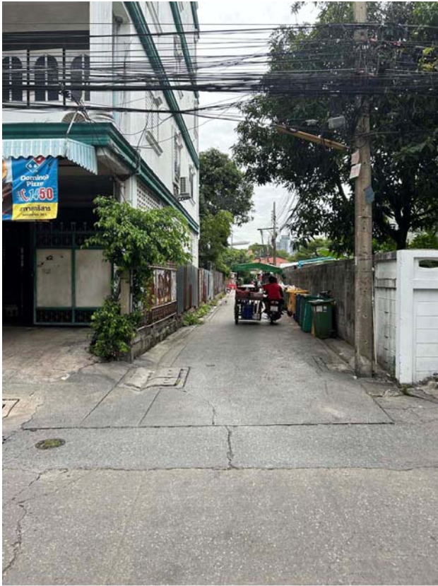
บริเวณหน้าทางเข้าที่ดิน