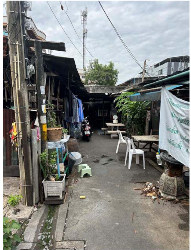
บริเวณภายในที่ดิน ฝั่งที่ทะลุซอยอินทามระ 43 และอินทามระ 41 ได้