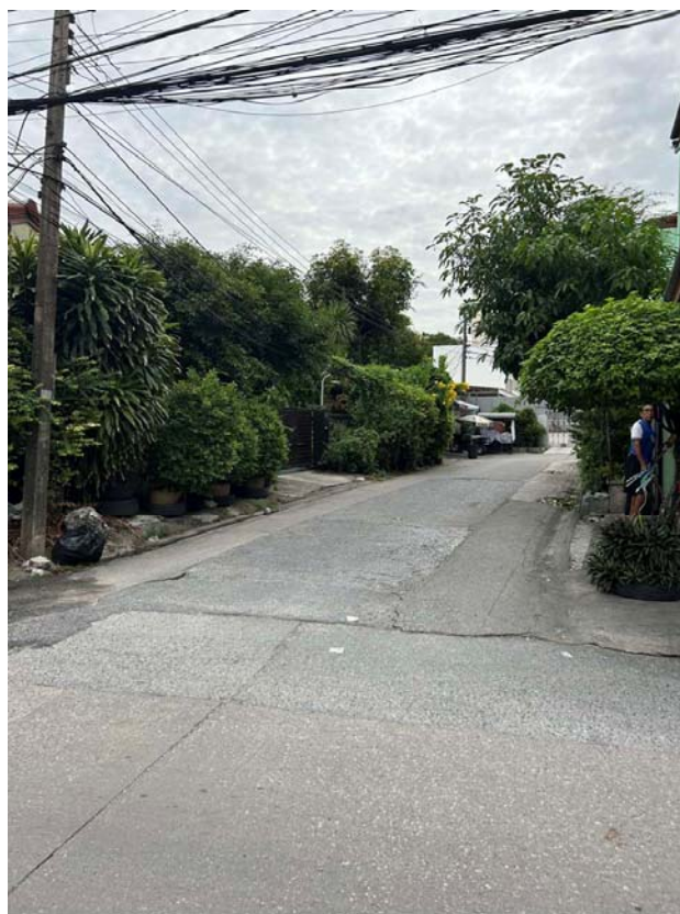
บริเวณถนนทางเข้าไปที่ดิน ซึ่งสามารถทะลุไปยังซอย อินทามระ 43 มีความกว้าง 6 เมตร