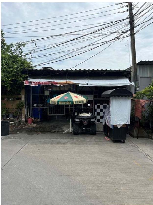
บริเวณที่ดินที่สามารถทะลุออกไปทางซอย อินทามระ 43 ได้