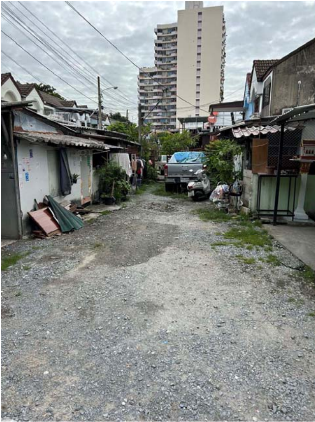
บริเวณภายในที่ดิน มีสิ่งปลูกสร้างเป็นบ้านเช่า และสามารถทะลุไปถึงถนนในซอยอินทามระ 43 ได้