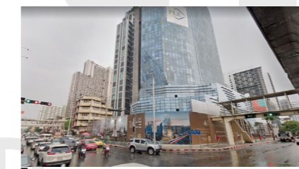
โครงการ THE RICE