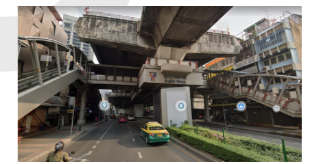
BTS สะพานควาย