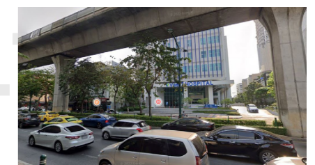
โรงพยาบาลวิมุต