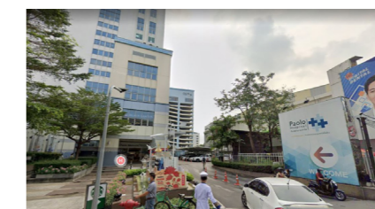
โรงพยาบาลเปาโล