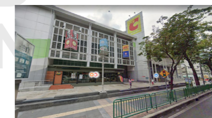
BIG C สะพานควาย