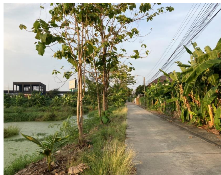
ถนนสวนกลางด้านข้างที่ดิน

พื้นที่เกือบครึ่งของ ที่ดินสวนด้านในเป็น บ่อน้ำ