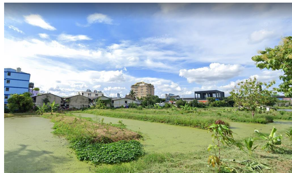
ด้านในที่ดิน